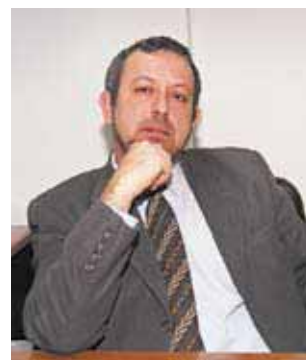
ΑΝΔΡΕΑΣ ΤΑΚΗΣ* Βοηθός Συνήγορος